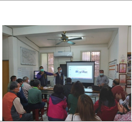
里長介紹本次宣導講師