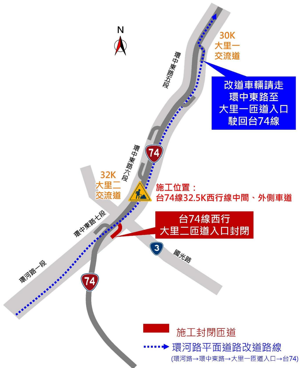
114/12/03台74線32.5K夜間施工(大里二匝道)西行線封閉疏導替代道路示意圖